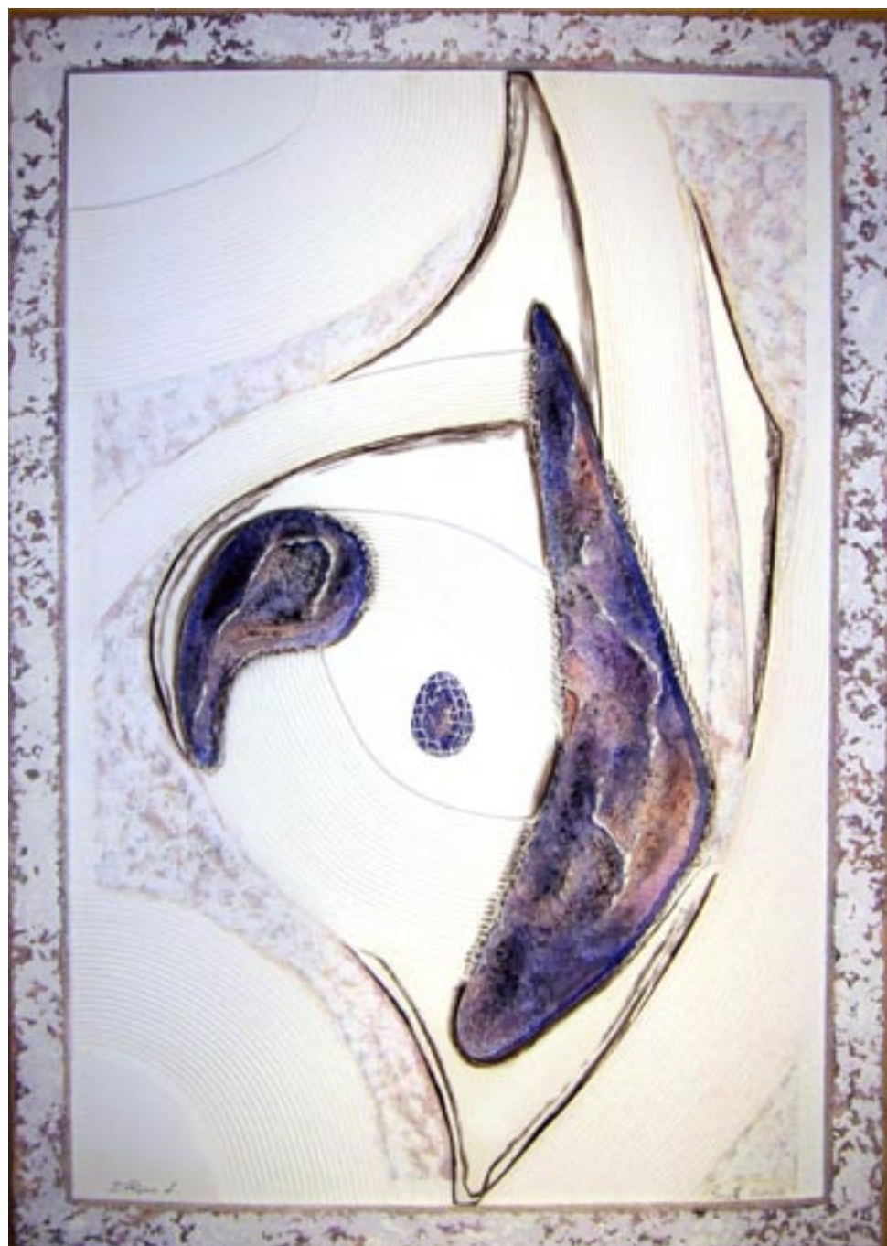
INVIOLE ESSENCE - Year: 2006 - Dimensions: Cm 130 X 90 ESSENZA INVIOLE ABILE - Anno: 2006 - Dimensioni: Cm 130 X 90