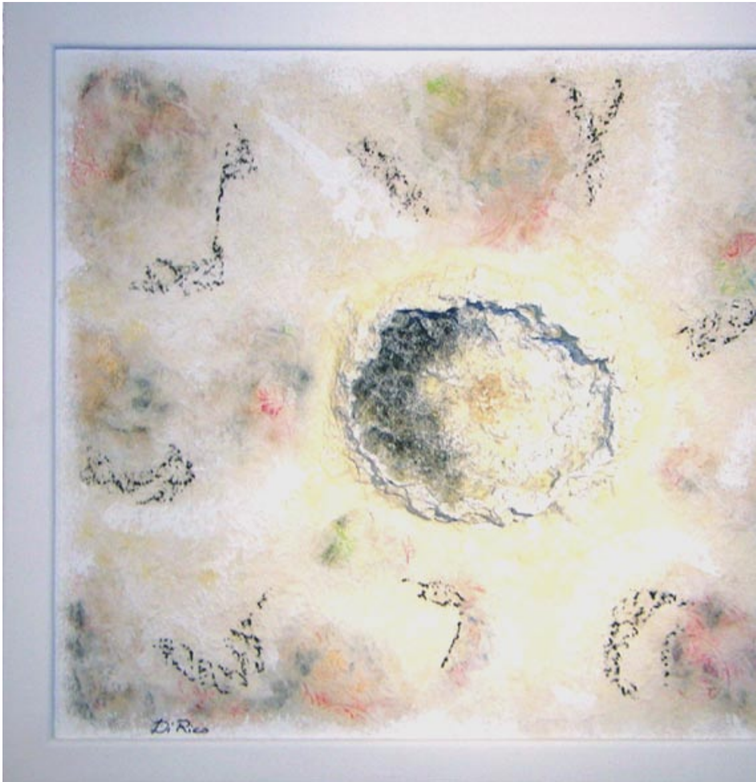
HIDDEN SHADOWS - Year: 2006 - Dimensions: Cm 90 X 110 OMBRE LATENTI - Anno: 2006 - Dimensioni: Cm 90 X 110