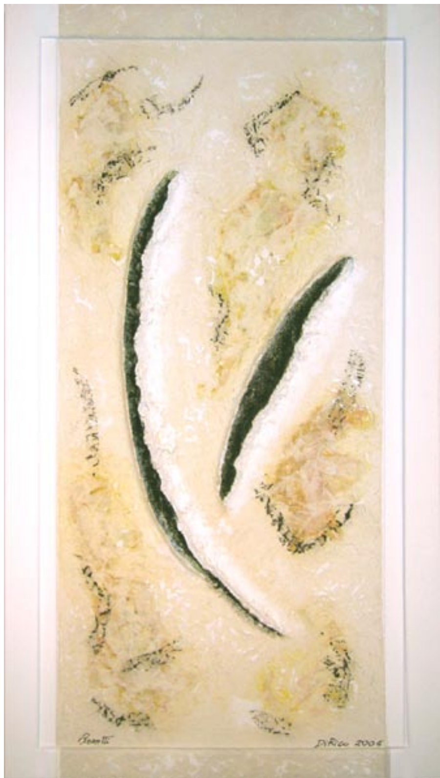
METAMORPHOSIS - Year: 2005 - Dimensions: Cm 130 X 70 METAMORFOSI - Anno: 2005 - Dimensioni: Cm 130 X 70